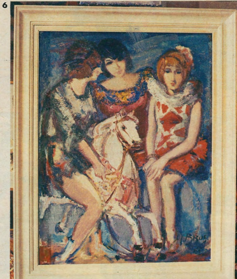
5 Als de kleuren roepen om bezieling...