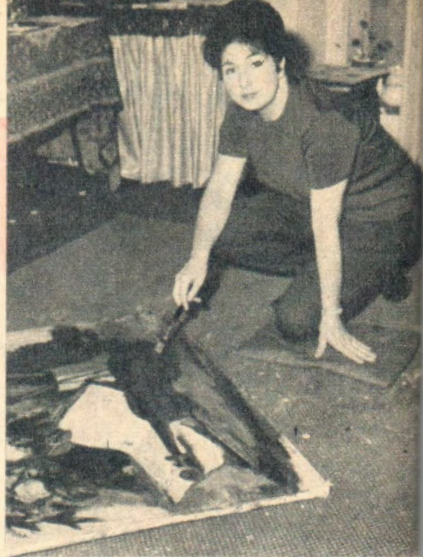
De kunstenaar in haar atelier. «Ik werk toch dikwijls aan de ezel ook!» zegt ze.

Men ziet het dit vlugge vrouwtje wel aan dat ze het allemaal aan kan en dat het haar niet moeilijk valt in