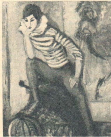
Deze « Harlekijn » op een achtergrond van Toulouse-Lautrec, peinst zijn droom voort in de verzameling Petrus te Wenen.

geeft het ertoe? — sterk uitkomt met al de karaktertrekken van die figuur of van die bloem.